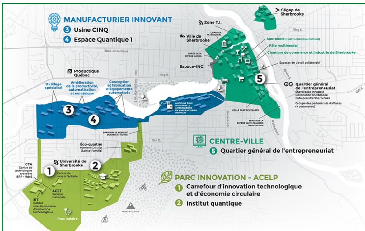
Carte de la zone d'innovation de Sherbrooke.

L'IQ a trois composantes : l'AlgoLab, le FabLab quantique et Curieux quantiques. L'AlgoLab est un laboratoire d'algorithmique quantique. Il possède un accès privilégié aux systèmes d'informatique quantique les plus performants du IBM Quantum Network ainsi qu'une expertise en calcul quantique unique au Québec. Le FabLab quantique est une plateforme d'équipements spécialisés pour la recherche en physique et en ingénierie quantiques. Il comporte un atelier de mécanique, pour la conception et la fabrication de pièces, ainsi que des équipements essentiels au développement de technologies quantiques. Enfin, Curieux quantiques se spécialise dans la vulgarisation des sciences quantiques par la création d'activités de sen-