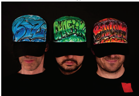
Le groupe Loco Locass fera une prestation lors de la journée d'accueil du 29 août.

En cas de pluie le spectacle et le dîner d'accueil auront lieu aux gymnases au CAP.