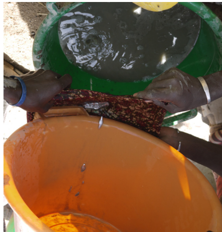
Des orpailleurs utilisant du mercure pour extraire l'or. Un travail qui assure leur moyen de subsistance, mais qui risque de les contaminer par la même occasion.