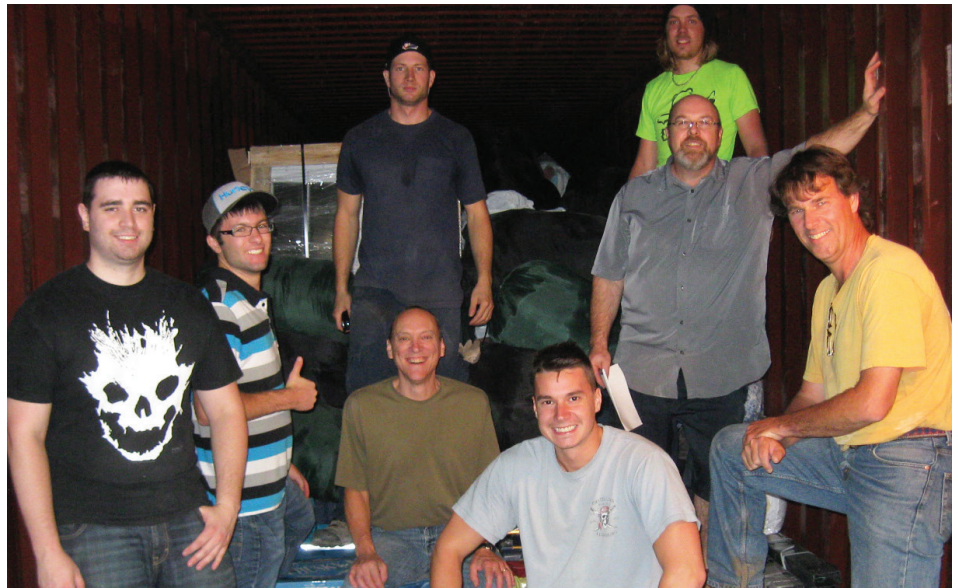
Photo prise lors du remplissage du conteneur par quelques étudiants du groupe en Logistique et transport du Cégep de Sherbrooke et dont le mandat consistait de participer à la logistique d'exportation d'une école préfabriquée accompagnée de plusieurs denrées à destination du Guatemala.