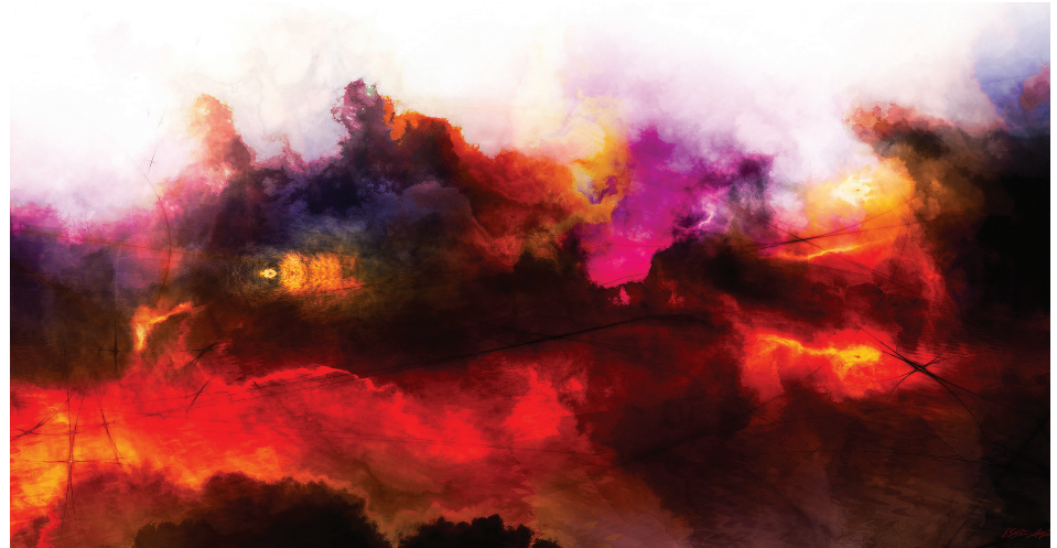
Oeuvre d'Étienne Saint-Amand

La Fondation Cégep de Sherbrooke tiendra, le 24 octobre prochain, son activité annuelle de financement Autumn'Art à la salle Saint-Michel de la basilique-cathédrale de Sherbrooke. Un repas à saveur française sera suivi d'une mise aux enchères de plus de 50 œuvres d'artistes différents. Les sommes recueillies serviront à soutenir les actions de