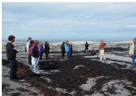
Parc national de Miguasha