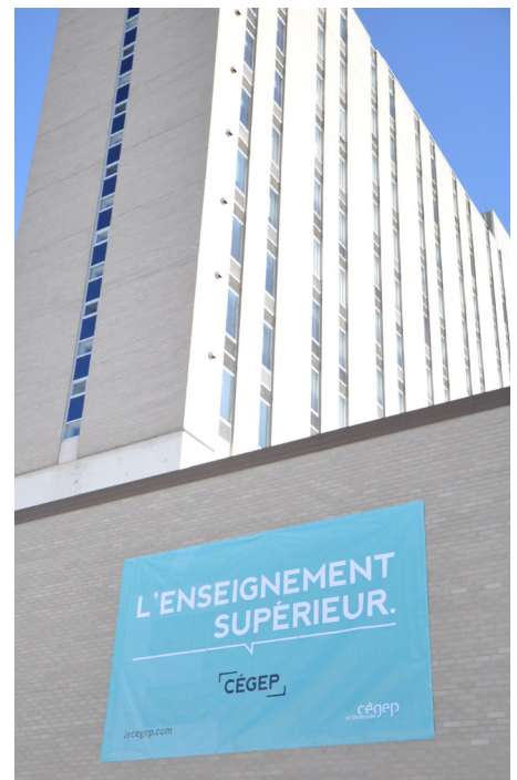
Le Cégep de Sherbrooke a profité de la rentrée 2015 pour arborer cette bannière issue de la campagne publicitaire du réseau collégial public qui a été apposée sur un mur du pavillon 6, visible de la rue Terrill.