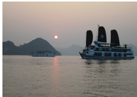
Couché de soleil sur la Baie d'Halong

Bref, la beauté culturelle sera assurément au rendez-vous au Centre des médias!