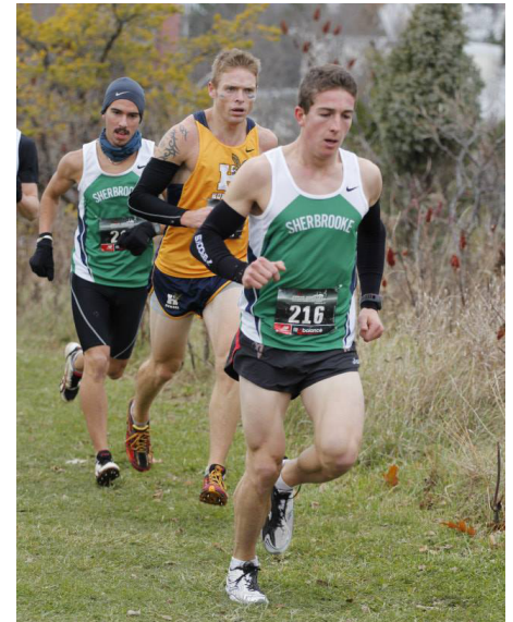
Quelques-uns des Volontaires en pleine action lors du dernier parcours de cross-country qui leur a valu la première place au classement du cross-country masculin!

Bravo à nos coureurs des Volontaires qui connaissent un début de saison époustouflant!