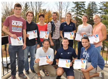
Des représentants des 6 équipes gagnantes du Défi Cégep actif 2014 ont reçu des cartes-cadeaux de la boutique Le Coureur.

Des prix de participation, offerts par FormAction, le comité des saines habitudes de vie et par la boutique Le coureur, ont également été distribués au hasard parmi les personnes présentes.