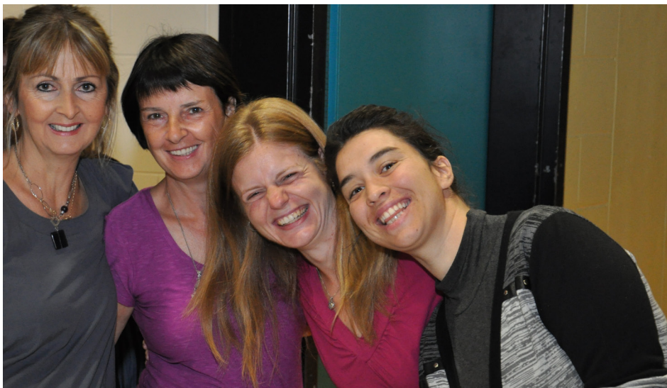
Le plaisir de se retrouver à la rentrée aussi pour le personnel.