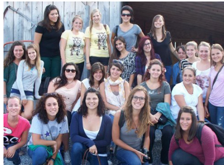
Le groupe Québec-Italie

Du 2 au 16 septembre , dix étudiants et étudiantes du cours complémentaire Ateliers de préparation à l'international recevaient un groupe de 20 personnes provenant de la ville de Vérone en Italie. Cette visite s'inscrit dans le cadre d'un échange étudiant auquel participent également des enseignants et enseignantes des établissements scolaires sherbrookoise et véronoise. Les participantes et participants inscrits au présent cours Ateliers de préparation à l'international du Cégep proviennent de trois programmes d'études : Sciences humaines, Sciences de la nature et Techniques d'éducation spécialisée. Ces derniers visiteront leurs pairs en Italie du 26 octobre au 9 novembre prochain.