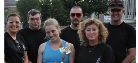
Coupe Défi étudiant catégorie B