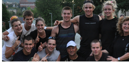
Coupe Défi étudiant catégorie A

La LICs vous invite à son premier match de la saison le jeudi 20 septembre à 19 h à l'Arti-Show au pavillon 6. Cette soirée mettra en vedette les quatre nouvelles équipes, avec un match double. Bienvenue à tous, c'est gratuit!