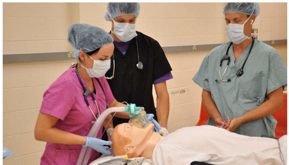
Une première simulation au Laboratoire d'apprentissage assisté par mannequins simulateurs